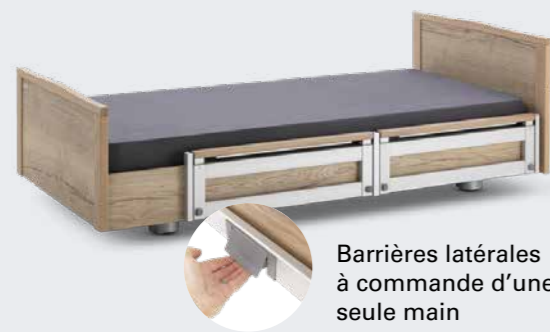
Barrières latérales à commande d'une seule main