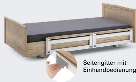
Seitengitter mit Einhandbedienung