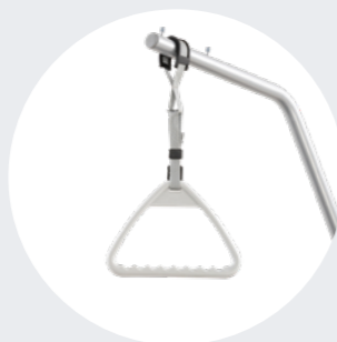
Bettaufrichter mit Griff